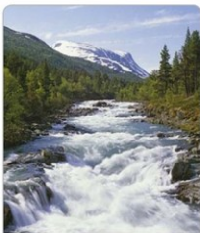
górnny bieg rzeki