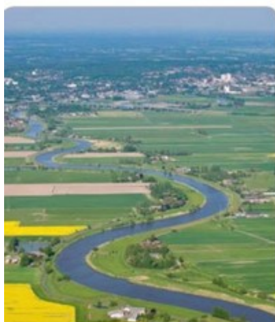
środkowy bieg rzeki