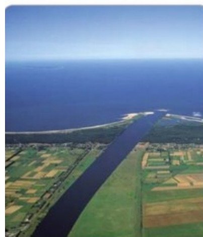
dolny bieg rzeki