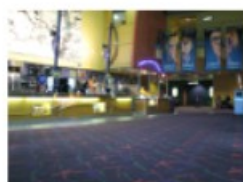
the movies inside