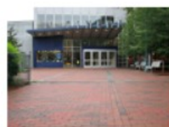
the movies outside