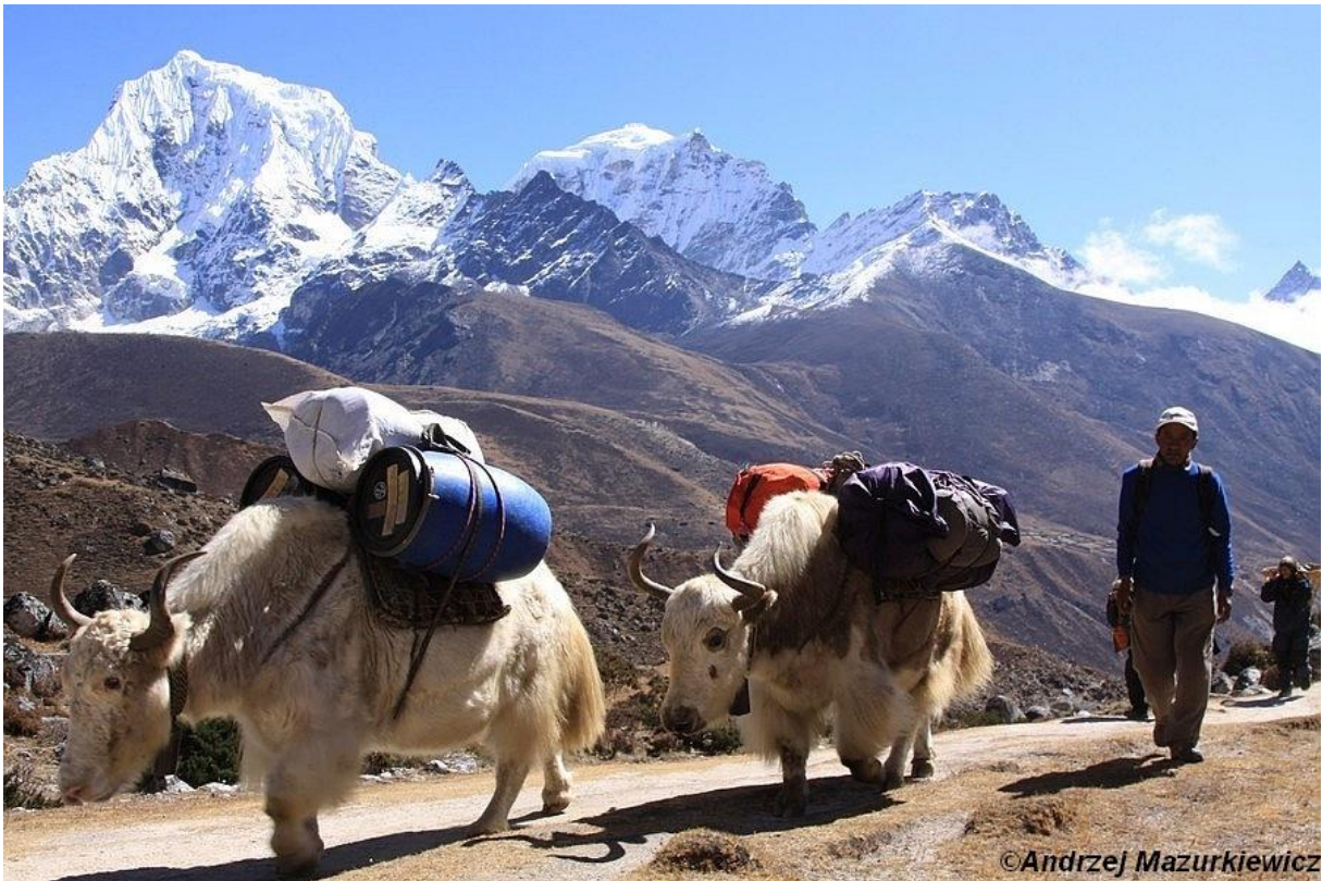
Jaki służą jako siła pociągowa dla Szerpów.