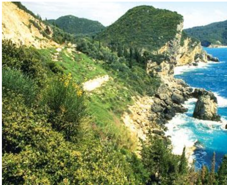
Typowy fragment makii śródziemnomorskiej ze skalistym wybrzeżem