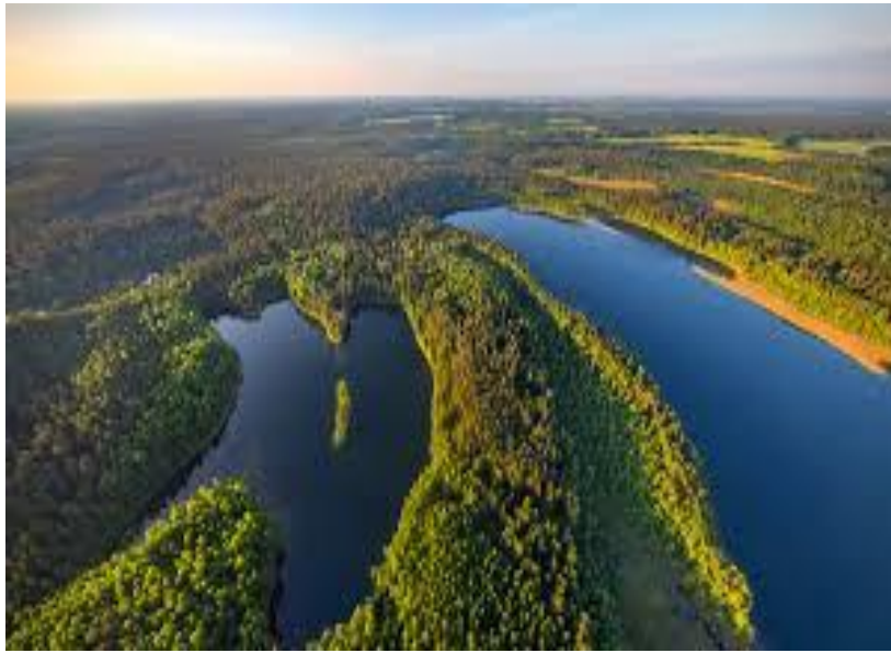
Grodno nad Niemnem