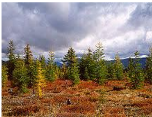
Tajga ( Syberia),