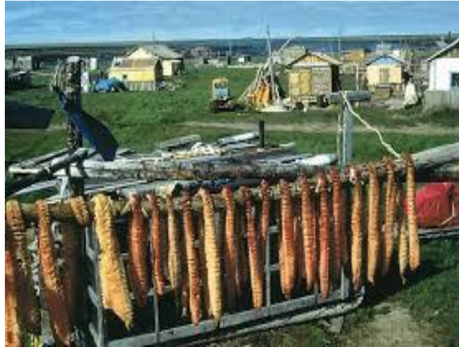
Wioska Jakutów w północnej Rosji. Na pierwszym planie suszą się ryby. Jedno z głównych zajęć mieszkańców to rybołówstwo.