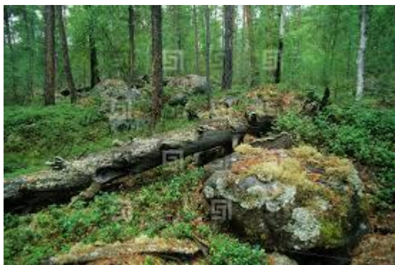
Runo leśne tajgi