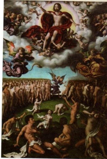
Joos van Cleve, Sąd ostateczny , ok. 1520

Komunia (od łac. communio ) – poczucie jedności, życie w jedności z kimś, np. z Bogiem, ze współwyznawcami. To także nazwa sakramentu przyjęcia Chrystusa pod postacią chleba i wina (Eucharystia) oraz nazwa części Mszy Świętej.